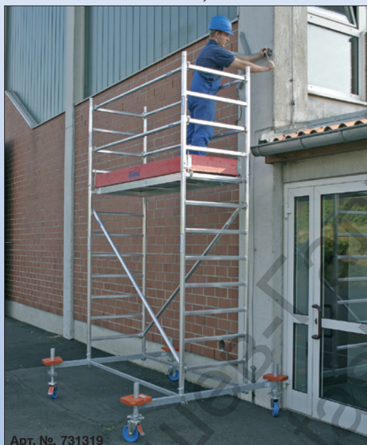
Арт. №. 731319