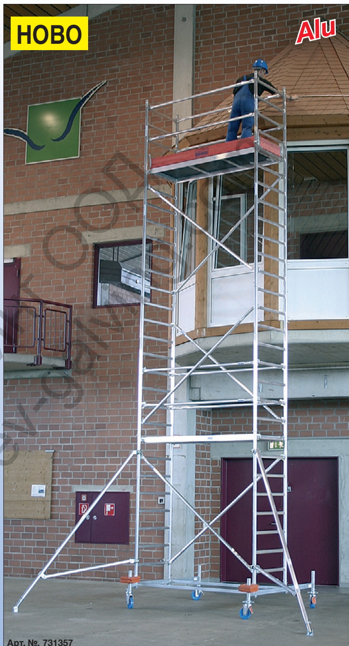
Арт. №. 731357

Частите от системата ще намерите след страница 84.